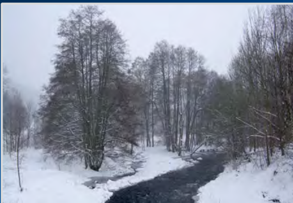
Die Selbitz im Winter