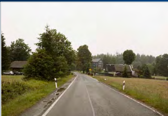
Ankunft in Rodacherbrunn